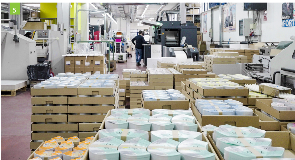
|| 3) e 4) Etichette nobilitate realizzate con Jet D-Screen. 5) Grazie alla tecnologia Cartes, Labeldoo.com ha aumentato la sua produttività.

più lavori sulla stessa bobina, e di produrre quindi molti più lavori completamente diversi nello stesso turno, riducendo da sette a tre giorni lavorativi il tempo medio di evasione degli ordini. Tutto questo aumentando la qualità delle nobilitazioni, sia nei dettagli più sottili che nei fondi pieni, e azzerando quasi completamente i costi di produzione e di archiviazione dei telai.